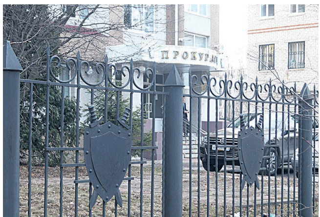
Здание губкинской прокуратуры

12 января свой профессиональный праздник отметили работники прокуратуры. По информации губкинской городской прокуратуры в 2016 году выявлено 4754 нарушения закона, по которым были приняты меры прокурорского реагирования: внесены представления, принесены протесты, предъявлены иски. За допущенные нарушения закона к дисциплинарной и административной ответственности по требованию прокурора привлечены 254 человека. Предостережено о недопустимости нарушения закона 81 лицо. В суде государственными обвинителями поддержано обвинение по более чем 400 уголовным делам. В гражданском судопроизводстве принято участие в 250 делах. Прокурором и заместителями изучено и направлено в суд порядка 413 уголовных дел по различным преступлениям. Рассмотрено 1100 обращений и заявлений граждан. Выявлено и поставлено на учёт 49 укрытых преступлений. За каждой цифрой этих показателей работы прокуратуры стоят восстановленные права и законные интересы жителей Губкинского городского округа.