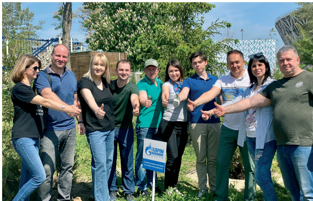
Мы сделали доброе дело!