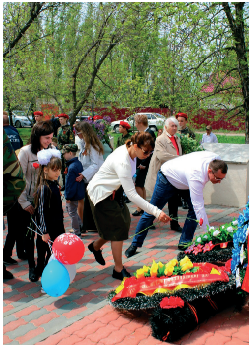
Молодые работники и специалисты Антиповского ЛПУМГ возлагают цветы к мемориалу героям войны в селе Антиповка

180 работников Общества и предприятий Объединения «Газпром в Волгоградской области», в том числе 90 детей приняли участие в патриотическом семейном онлайн-квесте на тему Сталинградской битвы под названием «Сталинградский рубеж».