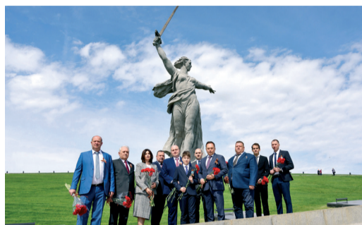
В «ГАЗПРОМ ТРАНСГАЗ ВОЛГОГРАД» ОТМЕТИЛИ 76-Ю ГОДОВЩИНУ ПОБЕДЫ В ВЕЛИКОЙ ОТЕЧЕСТВЕННОЙ ВОЙНЕ стр. 3