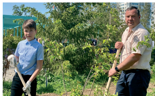
У ОБЩЕСТВА ПОЯВИЛСЯ СВОЙ «ЗЕЛЕНЫЙ» УГОЛОК В ЦЕНТРЕ ВОЛГОГРАДА стр. 3