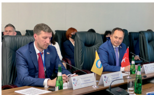
ГЕНЕРАЛЬНЫЙ ДИРЕКТОР ОБЩЕСТВА ПРИНЯЛ УЧАСТИЕ В ЗАСЕДАНИИ ПРОФИЛЬНОГО КОМИТЕТА ЮРПА стр. 2

Информационный бюллетень ООО «Газпром трансгаз Волгоград»