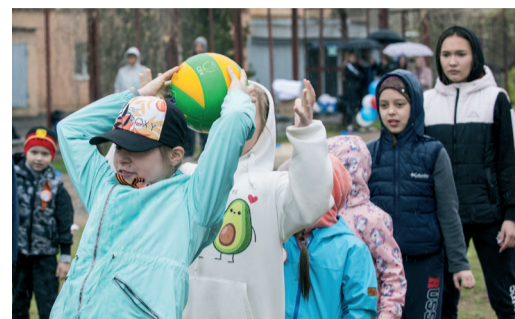
К 76-ЛЕТИЮ ВЕЛИКОЙ ПОБЕДЫ РАБОТНИКИ «ГАЗПРОМ ТРАНСГАЗ ВОЛГОГРАД» ПРОБЕЖАЛИ СПОРТИВНУЮ ЭСТАФЕТУ стр. 4