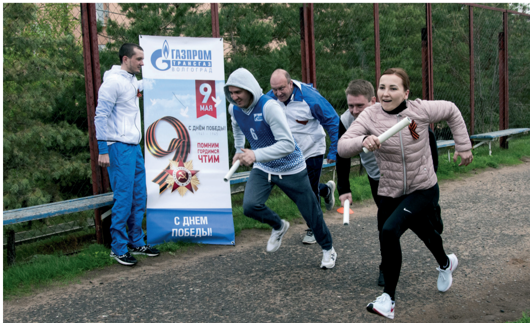
Участники эстафеты на скорость преодолели пять этапов по 76 метров каждый

24 апреля, в канун 76-летия Великой Победы, во всех филиалах «Газпром трансгаз Волгоград» состоялись праздничные спортивные мероприятия для работников и членов их семей: «Легкоатлетическая эстафета Памяти» и конкурс «Весна Победы».